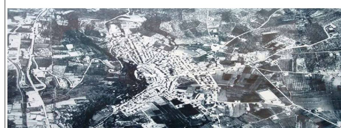
tavola n. 1.a - inquadramento territoriale 1:5000 (Elaborato aggiornato come da determinazione conclusiva Ufficio Tecnico n. 227 del 24/09/2021)

COMUNE DI TREVISO DA CANTIERA PROVINCIA DI PIEDICAVA